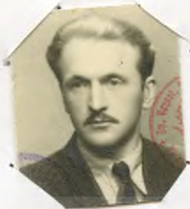
Zdjęcie mgie Dulka Adam 1846 r.