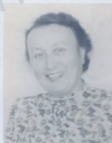
ok. 1952 r.