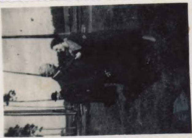
Wandka i Qiciec