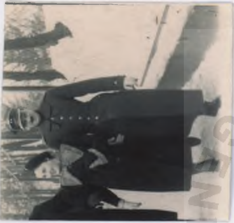
Wanoka i narzeczony