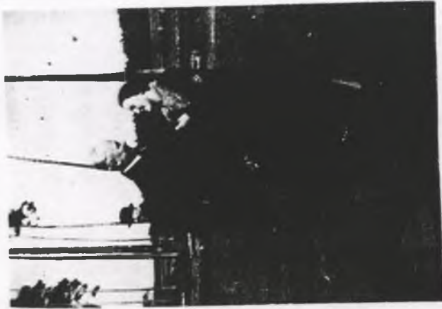
Wandka i Qiciec