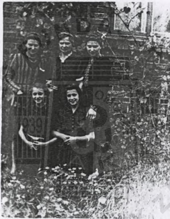
Terfite Mojso z wotkami i gostrenic - 1943.