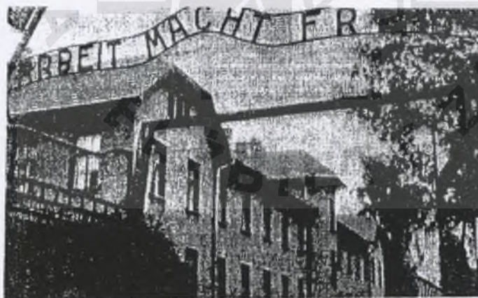
„Praca czyni wolnym”. Facytycznie jeden z nielicznych obozów

Załączam do tej publikacji kserokopię. No cóż, koniec życia, to i koniec życiorysu.