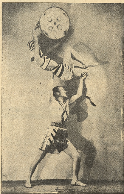
Jrena Soboltówna i Eugeniusz Wojnar

SKŁAD TOWAROWY w BYDGOSZCZY, FARNA nr. 1