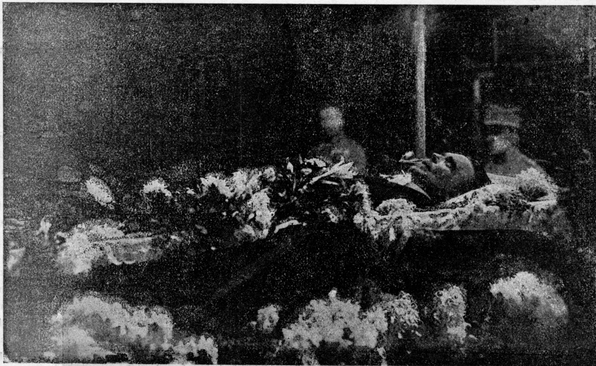
Zwłoki Władysława Reymonta w trumnie.