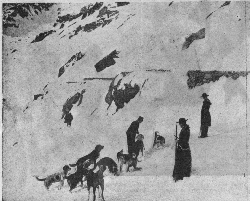
Wysyłanie słynnych psów sanbernardów w poszukiwaniu zaginionych podróżników. Na górze Św. Bernarda znajduje się klasztor imienia tego świętego. Tamtejsi zakonnicy zajmują się odnajdywaniem zabłąkanych i zaspanych podróżnych.