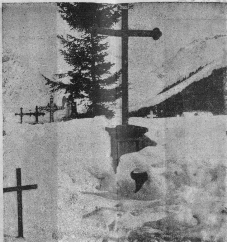
Cmentarz w Idyll koło Haspenthal zaspany śniegiem.