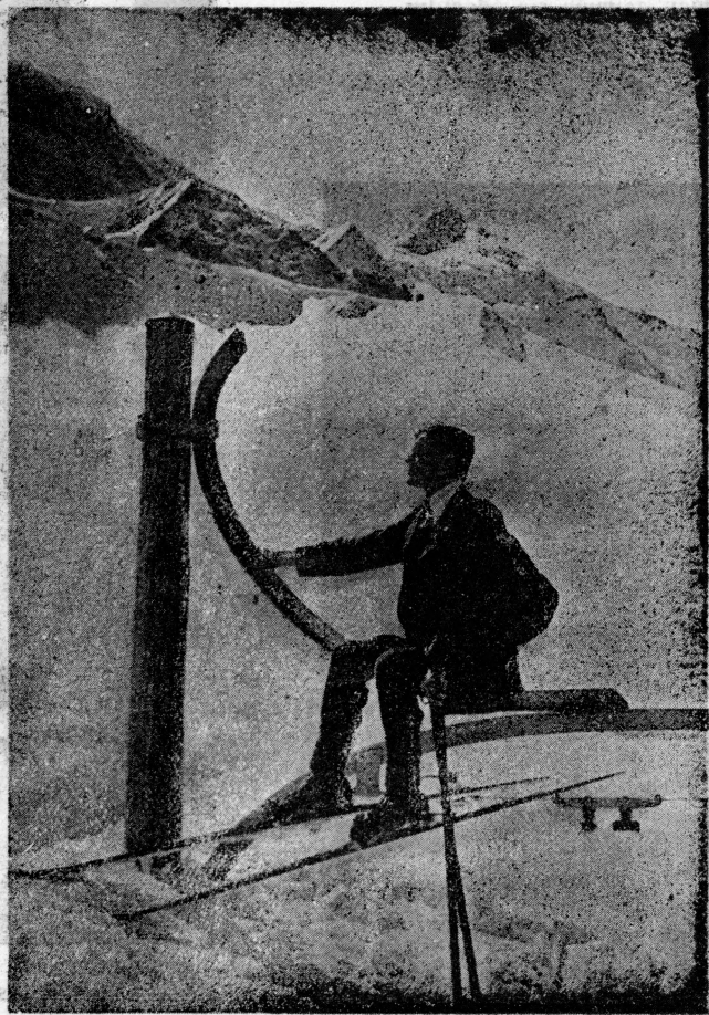
Jednym z najbardziej rozpowszechnionych sportów górskich jest jazda na specjalnych długich łyżwach drewnianych — ski. Fotografia powyższa przedstawia wycieczkę na nich w Wysokich Alpach w Szwajcarii.