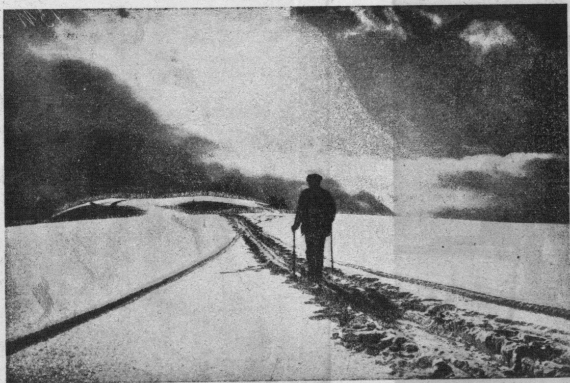
Po zachodzie słońca. — Samotny wędrowiec na pustyni śnieżnej.