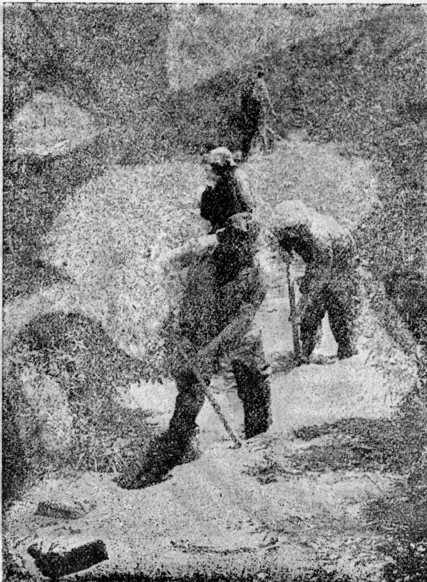
Odwadnianie mezarów pod uprawę.