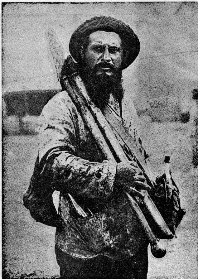
Rolnik - chasyd.

w dniu 8 b. m. minister Przemysłu i Handlu, p. Osiecki, otworzył Wystawę Palestyńską w Warszawie w obecności przedstawicieli władz, instytucji, prasy, itd. Ma ona rzekomo na celu nawiązanie stosunków handlowych Polski z Palestyną, lecz w istocie swej jest propagandą prac organizacyj sjonistycznych. W szeregu pokoi i sal Hotelu Paryskiego zebrano wielką ilość ciekawych i zajmujących ekspozycji, przedstawiających warunki pracy żydów w Palestynie, rezultaty osiągnięte w zakresie kolonizacji żydowskiej, stosunki gospodarcze, itd. Wystawa posiada materiał bogaty i zgrupowany bardzo starannie. Zwiedzających uderza zupełnie prawie pominięciem języka polskiego na wystawie, — to też dziwimy się, że polski minister, oraz przedstawiciele władz rządowych i komunalnych wzięli udział w jej otwarciu, nie przekonawszy się uprzednio, czy obecność ich nie naraża godności Państwa Polskiego.