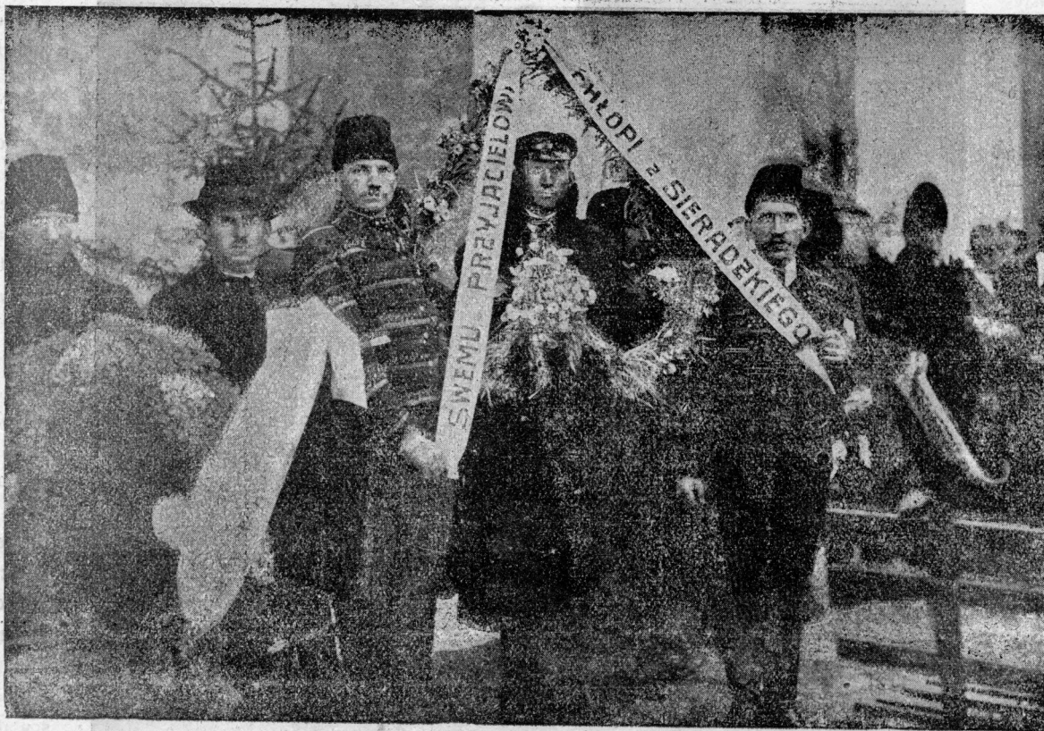
Delegacje włościańskie z wieńcami.