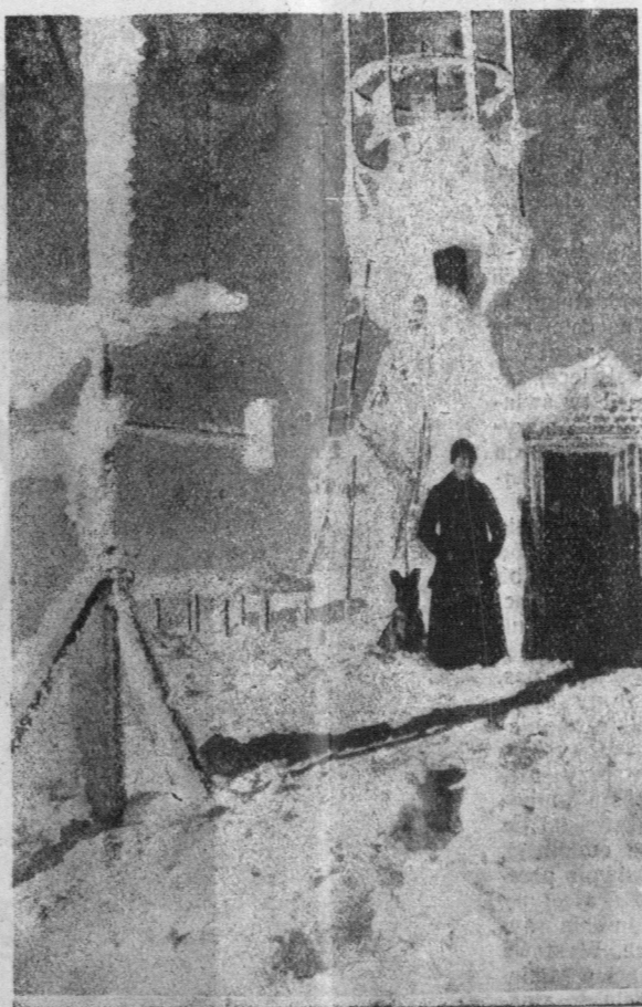
Obserwatorium Astronomiczne zaspane śniegiem i pokryte lodem.