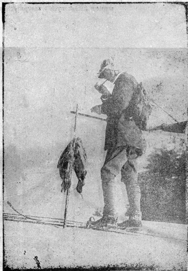
Człowiek musi się zawsze przystosować do przyrody. W błotach pińskich myśliwy zamiast butów nakłada łapcie z łyka, zaś w Szwajcarii musi być on równocześnie dobrym myśliwym i jeźdźcem na ski. Polowanie na jeźloro St. Morie.