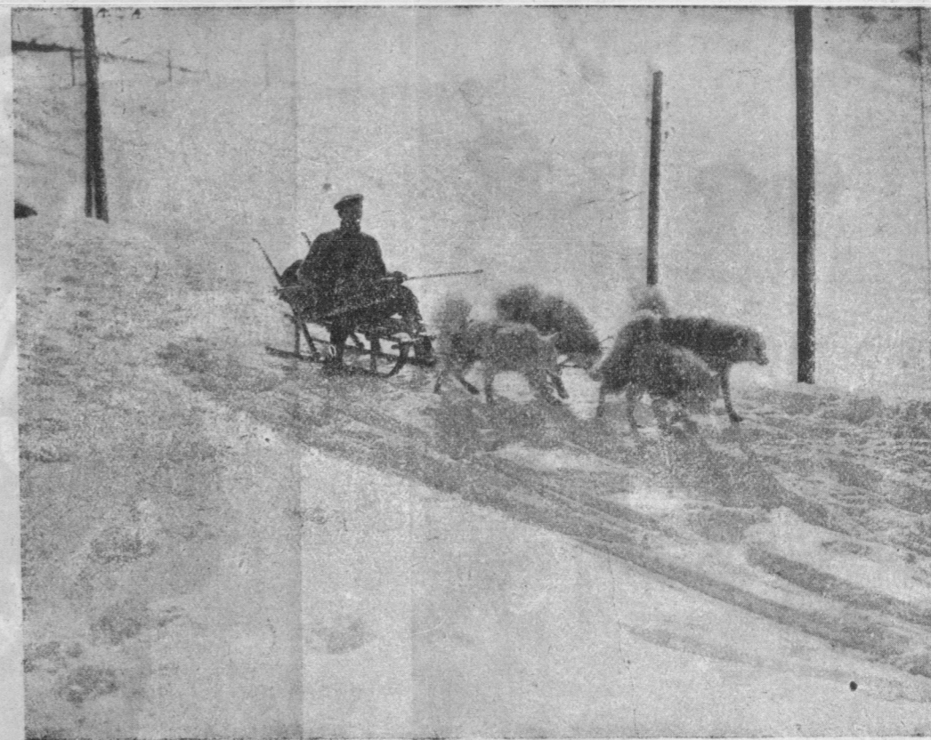
W chwilach, gdy wszystkie drogi są pozasypanywane, jedynym pojazdem, jaki może się przedostać przez zaspy śnieżne — są sanie zaprzężone w psy. Widzimy tutaj, jak taki psi zaprzęg ciągnie po śnieżnej drodze sanki z pocztą.