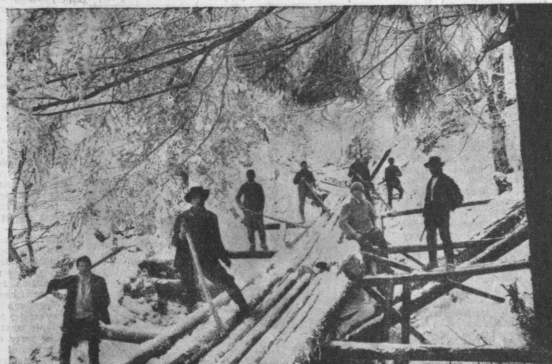
Transport drzewa w Wysokich Alpach.