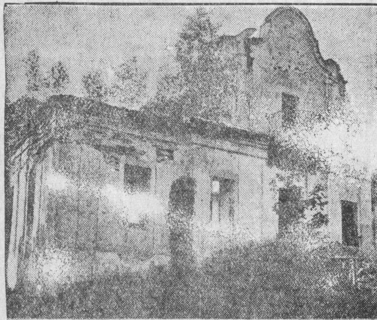
Na naszych Kresach.

Ruiny, które do dnia dzisiejszego sterczą w różnych okolicach Polski są wymownym świadectwem wandalizmu wojny światowej. Oto jeden z pięknych dworców polskich, który stracił właścicieli w zawierusze wojennej i dziś patrzy w świat napróżno wybiterni szymbami.