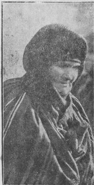
Stara włóścianka z pod Łowicza w swem charakterystycznym stroju.

Krot sie kore Pelonia slusnych wbiegły W d a wiecro i spiewan S r... spiewalo ki z swie go zwyc ności zgr W s wy, sty wiena si W E 4-glosow Kornniji zajęła po Prze połozon Pete zamisr i szkela j Pan dzianek? rzędu i osądzi, albo nie Czy urządzen ćwiczyć, zna przy grzanej ćwiczeni Czy wiemy, ale co z Kółko S cila nas Ura Znieszaw przewid ko być Co Niestety jak po się przy cy w ty i powi nym str