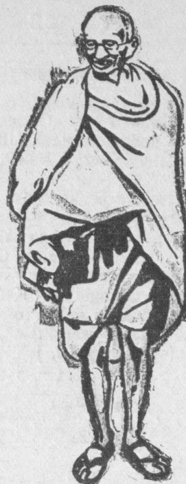
Mahatma Gandhi po powrocie z Anglii do [swe]j ojczyzny został aresztowany przez władze angielskie, co wywołało ogromne wzburzenie w Indiach.

„Całopalenie” ubrań europejskich w Bombaju w Indiach.