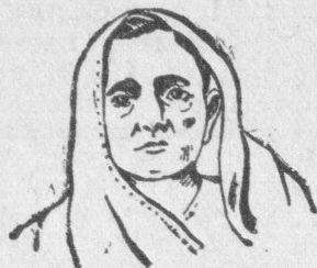
Żona Mahatmy Gandhiego.