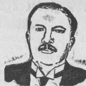
Zmarły min. Andree Maginot.

Od kilku dni po całym Paryżu krąży uporczywa pogłoska, że minister wojny, M. Maginot, nie umarł bynajmniej śmiercią naturalną, lecz został otruty. Otrucie nastąpić miało w ten sposób, że do spożywanego posiłku podrzucano mu bakterje tyfusu.