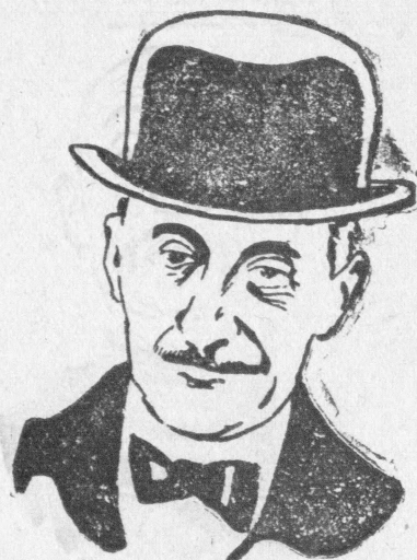
Wicekról Indji lord Willingdon reprezentuje władzę Wielkiej Brytanji w Indiach, z którą walczy Gandhi.

Żona przywódcy opozycjonistów została skazana w trybie uproszczonym na 6 miesięcy za opór władzy.