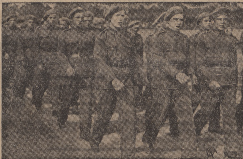
Na terenie dawnych koszar w Zajezierzu pod Dęblinem czynny jest Ośrodek Pracy Nr. 1 Stow. Opieki nad niezatrudnioną młodzieżą. Ośrodek ten zatrudnia 350 junaków w wieku od lat 16—24. Poza pracą, trującą 6 godzin na dobę, junacy przechodzą kurs przysposobienia wojskowego. Poza tem spędzają godziny poświecając na gry i sporty. — Na zdjęciu junacy w marszu