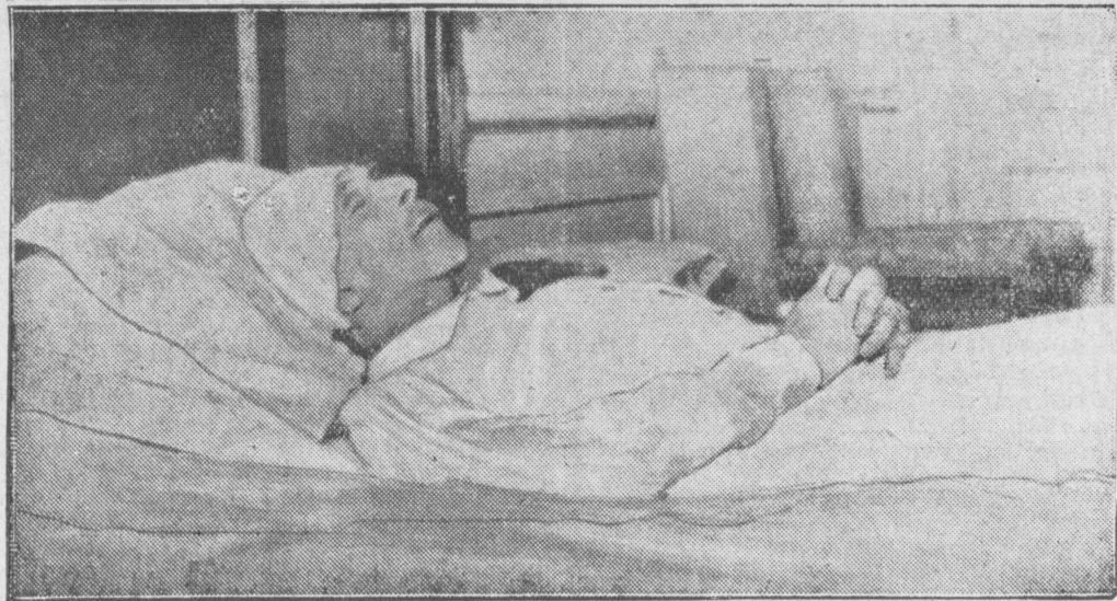
Król belgijski Albert I. na łożu śmierci.

W niedzielę uroczysty obchód odbył się w siedzibie dowództwa armji Dalekiego Wschodu w Chabarowsku, gdzie liczni mówcy podkreślali całkowitą gotowość obrony ZSRR.