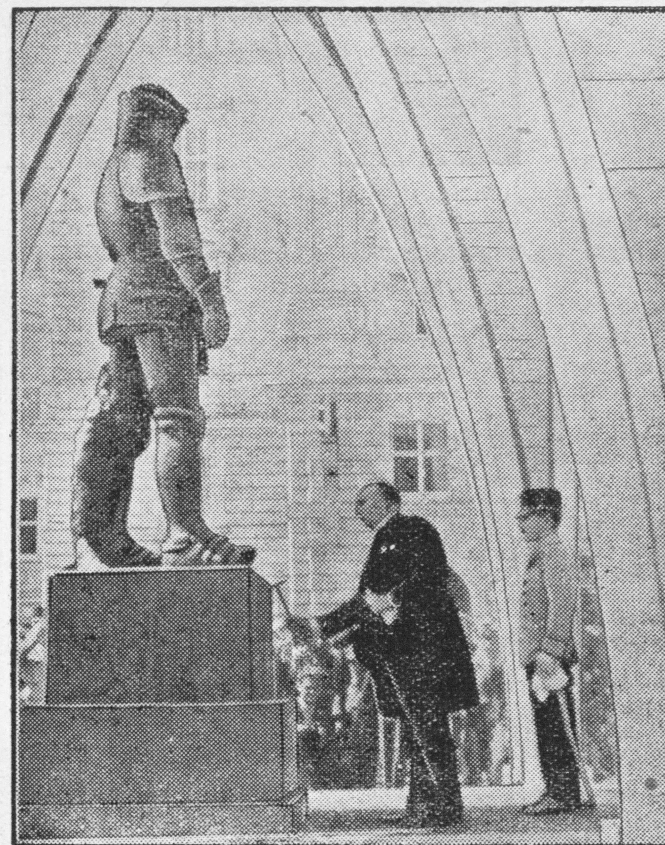
Prezydent związkowy Miklas wbija pierwszy gwóźdź.

Ten z wojny światowej pochodzący pomnik ma być obity gwoździ. Z uzyskanych z zakupionych gwoździ pieniędzy ma być postawiony pomnik Nieznanego Żołnierza.