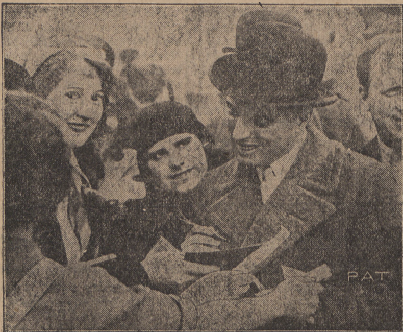
Przybył do Londynu Charlie Chaplin, witany owacyjnie przez zebrany przed dworcem olbrzymi tłum, który przez wiele godzin czekał cierpliwie na przybycie słynnego aktora filmowego. Zdjęcie: Charlie Chaplin „rozdaje” autografy.