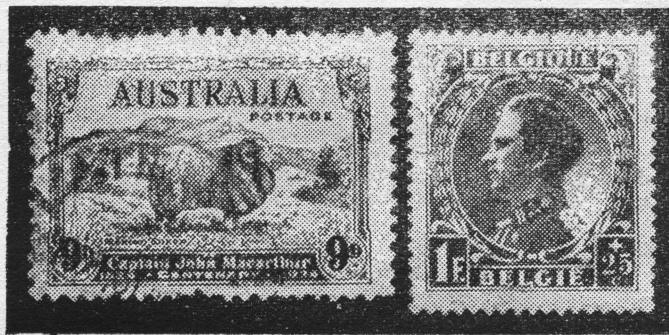
Belgia wydała pierwsze znaczki z podobizną młodego króla Leopolda II, a Australia 100 lecie wprowadzenia owiec rasy merino (główne bogactwo stanowią bowiem owce) uczciła również specjalnym znaczkiem.