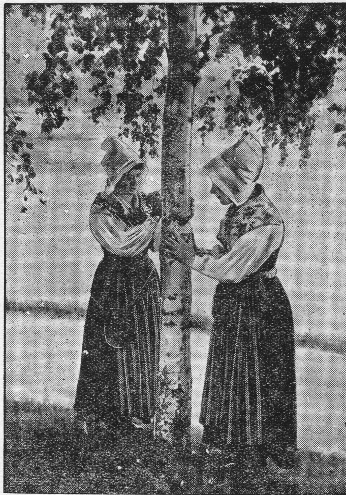
Oto Szwedki w strojach narodowych, wyrzynając w święta Zielonych Świąt w brzozie inicjały swych narzeczonych, mają nadzieję wyjścia za mąż jeszcze w tym roku.

W innych miejscowościach znowu ten, który najpierw swoje bydło wypędzi na łąki zostanie