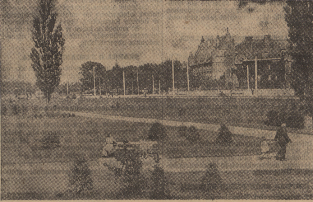
Spojrmy na ten śliczny, nowy salon Torunia z kilimami trawników, z kobiercami kwieciami.

Nie można zaprzeczyć, że Toruń jest ślicznym miastem. Nie przemawia przede mną patriotyzm lokalny. Proszę spojrzeć na te dwa fragmenty załączonych obrazków. Każdy ma swoją wymowę. Jeden z nich to wspa- fajszywe Łuki Cezara, jakiego „korki”, forty. Zrobiło się wiele. Dzisiaj jest się czemś pozyczyć przed obcymi. To już nowoczesny Toruń taki inny i różny od Starego, ciasnego Torunia, przepelnionego pamiątkami, że się