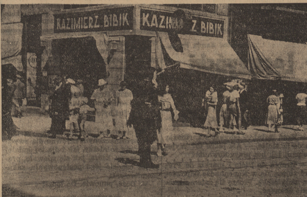
„Tak przechodzić nie wolno!” — z uśmiechem zatrzymuje posterunkowy roztargnioną panienczkę.

niała perspektywa z placu Bankowego na ulicę Szopena, na precudne dywany traw, na kobierce i kilimy kwiatów. Tu w słońcu dogasającego lata dziatwa i emeryci biorą