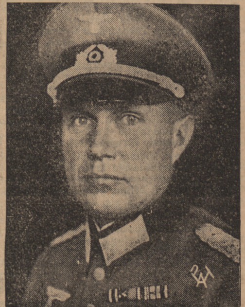
Nowomianowany attache wojskowy przy Ambasadzie niemieckiej w Warszawie płk. B. von Studnitz.