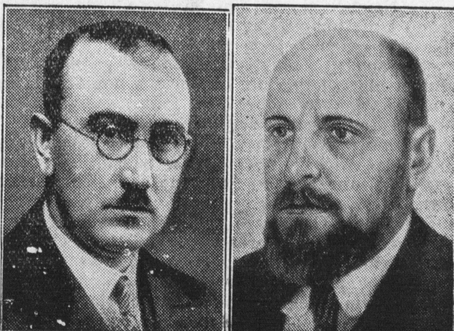
Bułgarscy politycy: b. premier Zankoff (z prawej) i b. premier Georgieff (z lewej) zostali wysiedleni do pewnego miasteczka nad morzem Czarnym.