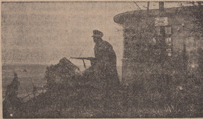
Nad brzegiem morskim wznosi się wartownia nadmorskiej polskiej straży granicznej. Po lewej widać otwartą przestrzeń Bałtyku. Warto wnie nadmorskie zostały zbudowane w ostatnich czasach przez rząd polski.