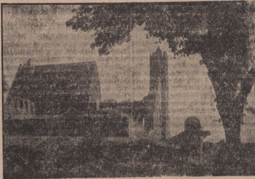
Ruiny zamku krzyżackiego w Radzynie