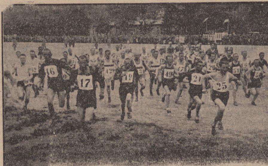
W chwili po starcie III. Pomorskiego Drużynowego Biegu Naprzelaj o puchar „Dnia Pomorskiego”