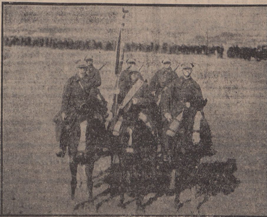
Poczet sztandarowy 18 Pułku Ułanów Pomorskich.

Przejścia te świadczą chlubnie o wewnętrznej dyscyplinie i wysokich wartościach moralnych ułanów pomorskich, których wierne fale Bałtyku doprowadziły do