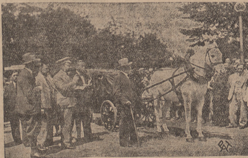
Łódzkie Towarzystwo opieki nad zwierzętami zorganizowało konkurs na najlepiej utrzymanego konia dorożkarzkiego. Konkurs wzbudził duże zainteresowanie nie tylko wśród dorożkarzy ale i społeczeństwa łódzkiego. Do konkursu stanęło kilkadziesiąt dorożek. Zdjęcie nasze przedstawia zwycięską dorożkę, która w konkursie zajęła pierwsze miejsce. Ciekawą inicjatywą Łódzkiego Tow. Opieki nad Zwierzętami winny się zainteresować i inne miasta.