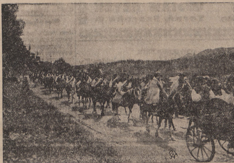
W ramach Święta Huculszczyzny odbył się poka z Wesela Huculskiego. Na zdjęciu — orszak weselny.