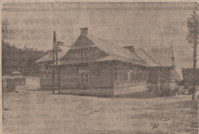
Sanatorium im. ś. p. Michaliny Mościckiej, pod Krasnobrodem, którego poświęcenie odbyło się w tych dniach przy udziale Pana Prezydenta Rzeczypospolitej.