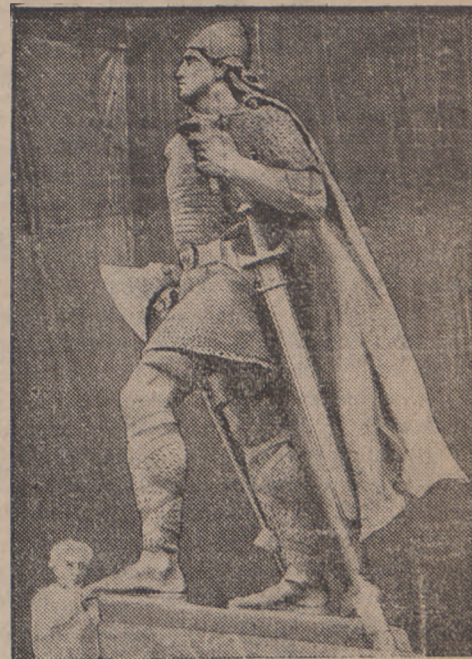
Z okazji 1000 lecia państwa islandzkiego Ameryka ofiarowała Islandji olbrzymią statuetkę bohatera islandzkiego Leifa Eriksona, dzieło no wojorskiego rzeźbiarza Stirlinga Caldera.