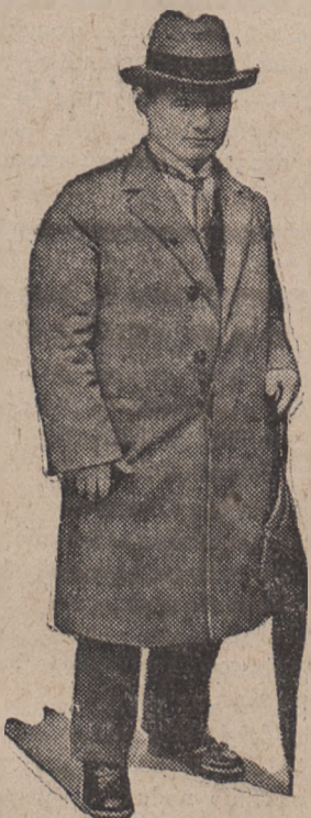
przeciwko któremu obecnie toczy się sensacyjny proces.