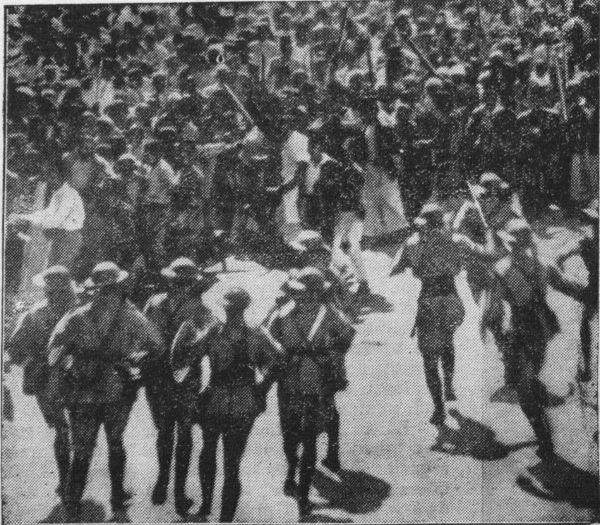
W Palestynie dalej toczą się krwawe walki. Na zdjęciu wojsko angielskie rozprasza manifestantów arabskich w Jerzolimie.

Pod Nablus na patrol angielski, strzegący reperacji telegrafu, napadł oddział arabski, złożony z 400 do 500 ludzi. Wywiązała się zaciepła walka, w której Arabowie stracili trzech zabitych, Anglicy dwóch ranionych. Oddział angielski ściga przeciwnika w górach.