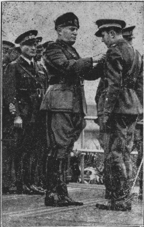
Mussolini odznaczył wielu oficerów lotniczych, a m. in. i swoich synów za dzielność w wojnie abisyńskiej.

Jaki cel ma tego rodzaju nowelizacja regulaminu wyborczego, w tej chwili trudno się zorientować. W każdym razie jest ona dalszym odroczeniem terminu zwołania rad miejskich w Poznaniu i Łodzi.