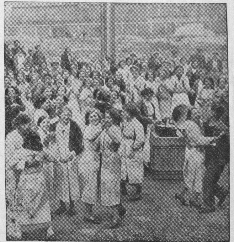
Robotnice fabryk francuskich w czasie strajku urządziły sobie tańcówkę w fabryce.

9. Każdy człowiek ma inną konstytucję ciała. Jednemu służy to, co drugiemu może zaszkodzić. Dlatego nie powołujmy się na wzory znajomych, którzy wytrzymują prażenie się w słońcu lub