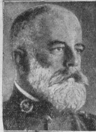
Gen. Cabanellas, jeden z dowódców wojsk powstańczych w Hiszpanji, stanął na czele narodowego rządu powstańców