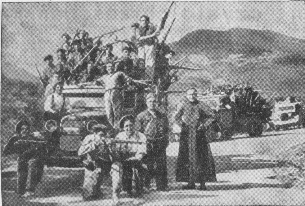
Na zdjęciu oddziały powstańców hiszpańskich, przewożone samochodami ciężarowymi na pole walki. Zwraca uwagę postać księdza w sutannie obok samochodu.

Paryż. 10. 8. Agencja „Fournier” donosi z Madrytu, że dziś w godzinach rannych gabinet Jose Girala podał się do dymisji. Nowy gabinet utworzył przywódca prawego skrzydła stronnictwa socjalistycznego, Indalecio Piatro.