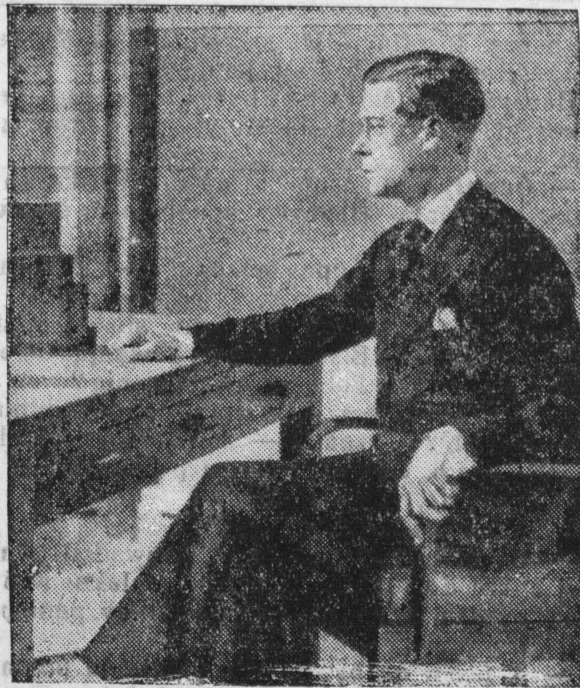
Edward VIII, król angielski, abdykował.