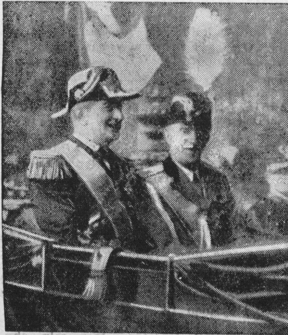
Regent Węgieł, Horthy, złożył wizytę w Rzymie. Na zdjęciu Horthy w towarzystwie króla włoskiego Emanuela w drodze z dworca.

Adwokaci Polacy wystali do Rady Adwokackiej we Lwowie i Krakowie pismo, zakładając protest przeciw stałemu przez Żydów upośledzaniu olaków-adwokatów oraz składając równocześnie swe mandaty do władz adwokackich.