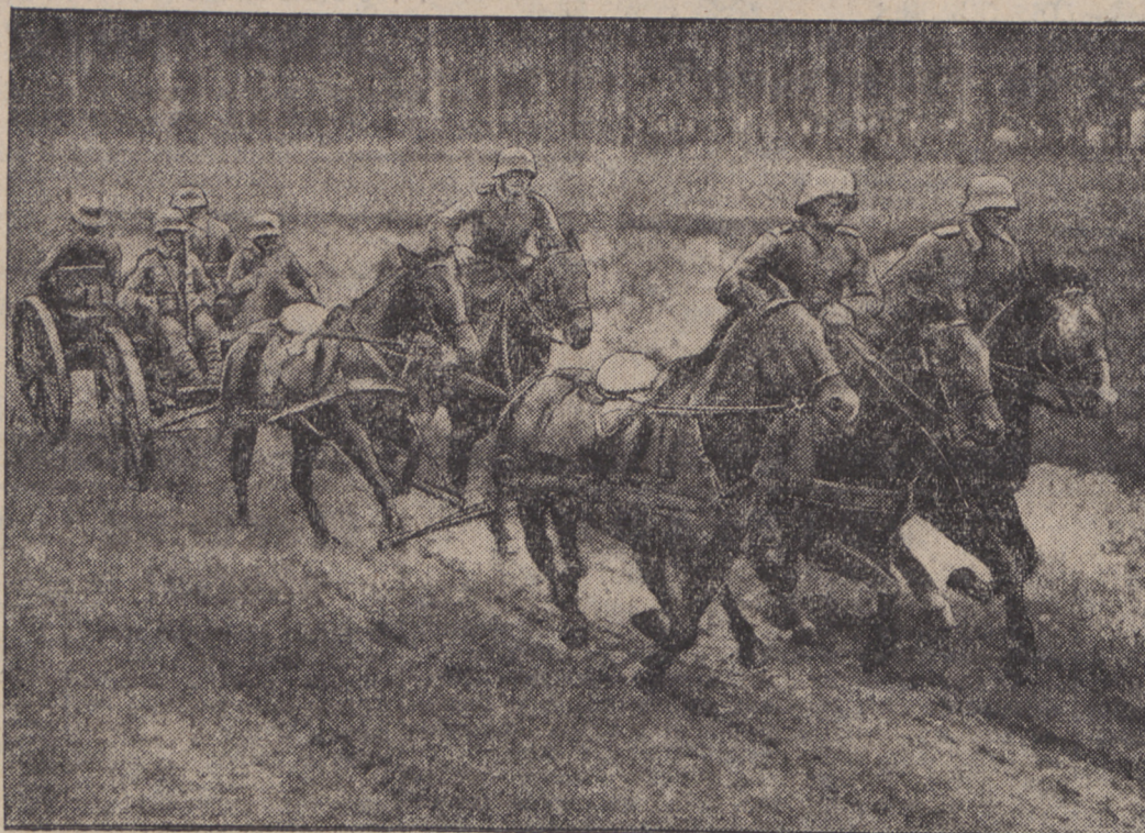
Manewry rozbrojonych Niemiec nad granicą polsko-niemiecką.