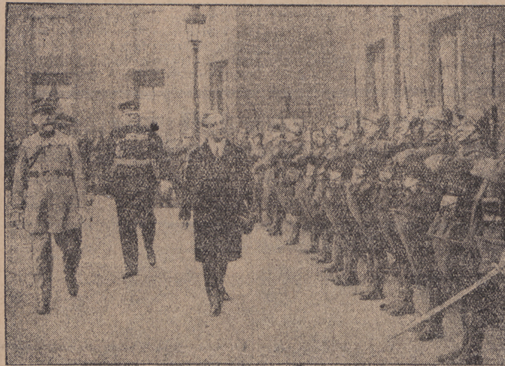
W Paryżu bawi obecnie król jugosłowiański Aleksander I w celu przeprowadzenia pertraktacji w sprawie udzielenia Jugosławii pożyczki w wysokości 2 miliardów franków. Powyżej król jugosłowiański przechodzi przed frontem kompanii honorowej na dziedzińcu pałacu prezydenta.