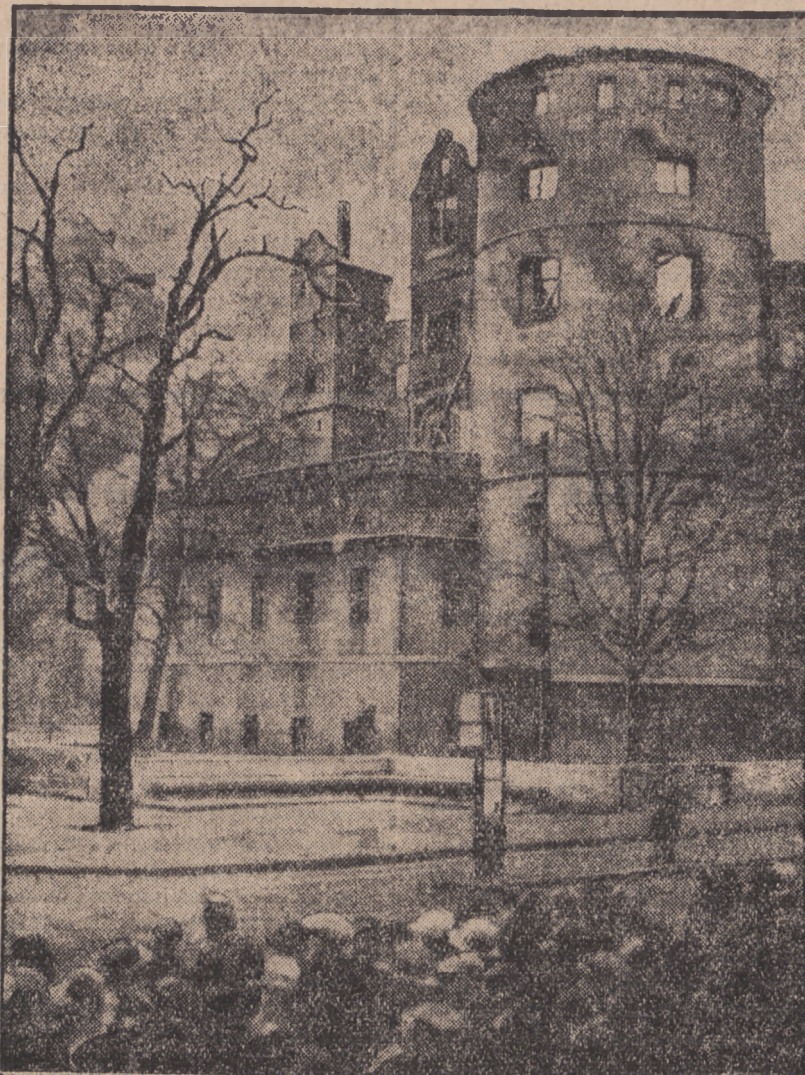
Starożytny zamek w Szlufgardzie padł, jak już donosiliśmy, pastwą płomieni. Pożar, którego mimo najwyższych wysiłków straży pożarnej nie zdołano stłumić, przybrał tak groźne rozmiary, iż cała stolica Württembergi pokryta była gęstym obłokiem dymu.