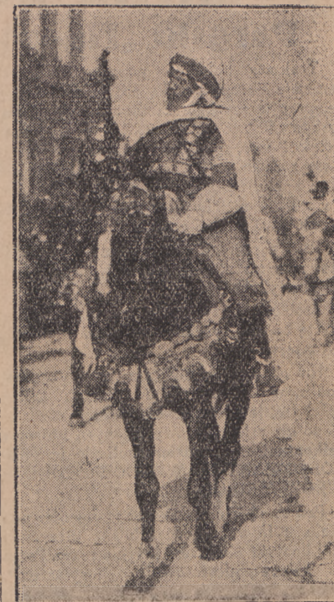
Zdjęcie nasze przedstawia kaprala kawalerii „Reguleros” tj. wojsk marokańskich walczących na służbie hiszpańskiej. Pełnił on tę służbę od lat 24, a ranny był przeszło 20 razy biorąc udział we wszystkich ważniejszych bojach od roku 1907 w Maroku.

Niech każdy mieszkaniec Polski kupi choć jedną nalepkę za 10 groszy, a zbierze się miliony złotych na walkę z gruźlicą.