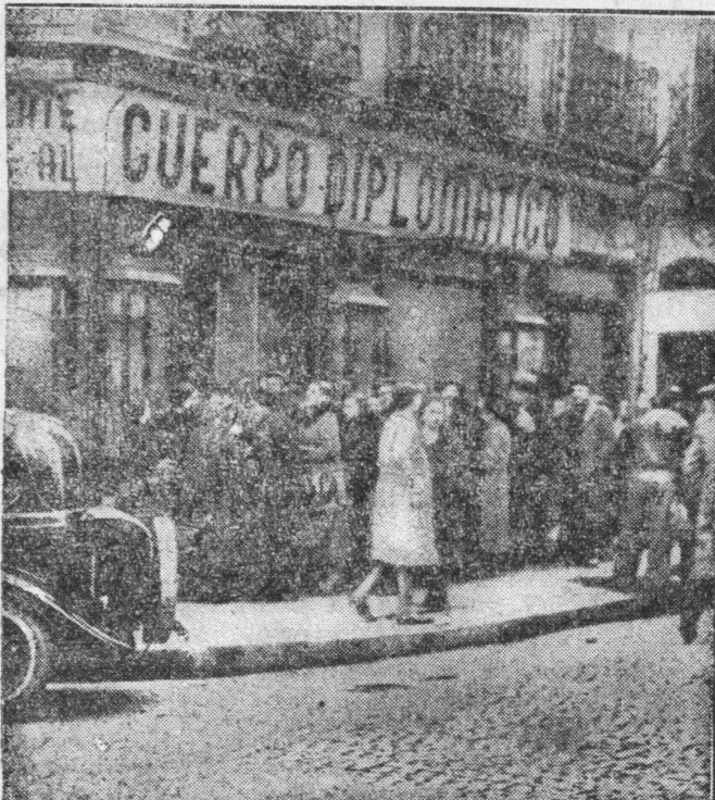
W czerwonym Madrycie odczuwa się brak środków żywności. Nawet cudzoziemcy otrzymują tylko skąpe porcje żywności. Przed sklepami tłoczą się długie „ogonki”.

W nocy z soboty, 20 na niedzielę 21 bm., zaczął obowiązywać zakaz werbunku i wyjazdu ochotników z poszczególnych krajów do Hiszpanii — zdecydowany uchwałą komitetu nieinterwencji w Londynie.