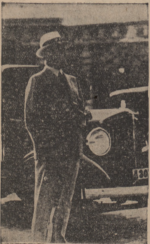
Arcyksiążę Otto Habsburg, który ostatnio przebywał w Sztokholmie w sobotę opuścił Szwecję. Cel dalszej jego podróży jest trzymany w ścisłej tajemnicy.