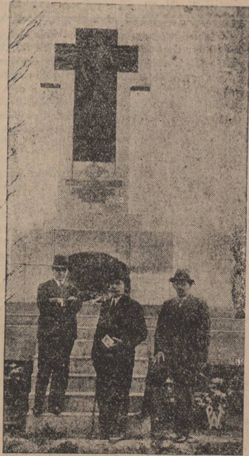
Delegacja Rady porozumienia Związków Polaków we Francji udala się pod pomnik poległych bohaterów w La Targette (dep. Notre Dame de Lorette), celem zabrania stamtąd ziemi na kopiec Marszałka Pilsudskiego w Krakowie. Na zdjęciu: delegacja przed pomnikiem w La Targette.