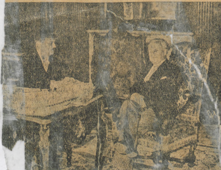
Nowy ambasador sowiecki Potiomkin (z prawej) podczas wizyty u ministra granicznych Laval.