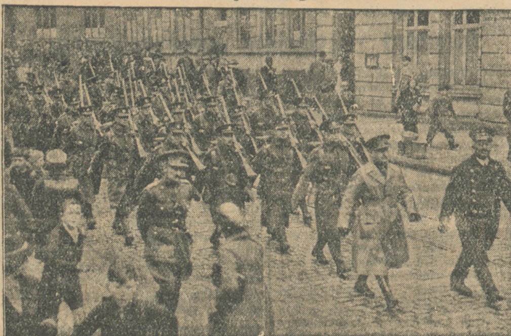
Wjeście oddziału wojsk angielskich do Saarbruecken.