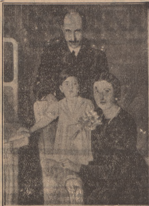
Marja Ludwika, jedyna córka królewskiej pary bułgarskiej, ukończyła w dniu 14 bm. dwa lata. Na zdjęciu król Borys z żoną i córeczką.