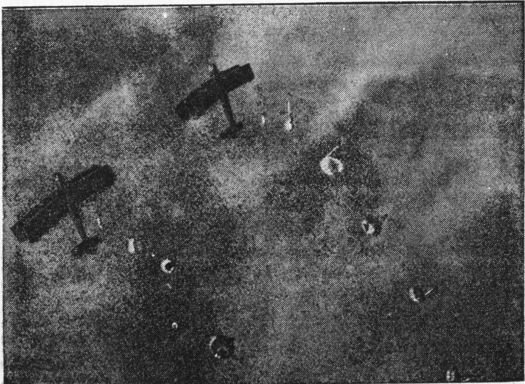
Effektowny widok samolotów, opuszczających prawie równocześnie ćwiczące samoloty w Henlow (Anglia).