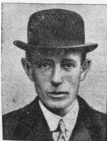
Angielski min. spraw zagr. lord Halifax.

Czy to nie charakterystyczne pytanie — po co potrzebny był przewrót majowy? W pytaniu tym mieści się i odpowiedź: — dla Żydw był potrzebny na to, ażeby uchronić ich przed „rządami endeckimi“. To bowiem była główna troska polityki żydowskiej w czasie wojny i konferencji pokojowej, jako też główną ich troską stało się w Polsce niepodległej.