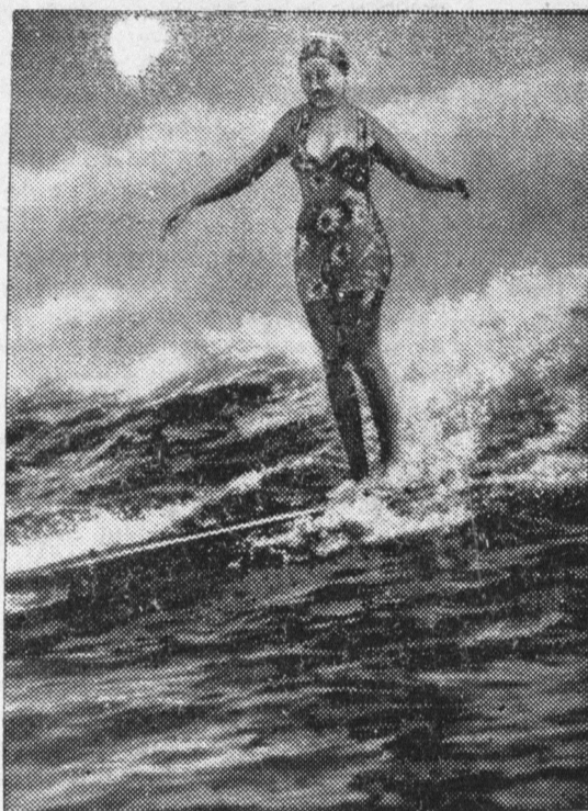
Piękność hawajska zażywa popularnego sportu.

Nigdy nie zapomnę osobliwego zachowania się dziewczyny podczas brania miary i potem, gdyśmy do pani Desberger wracały. Na pozór zimna i spokojna, dawała krawcowej na wszystkie strony się obracać, ale w głębi oczu ukrywał się wyraz przerażenia, który jej trochę i ból wewnętrzny zdradzał. (C. d. n.)