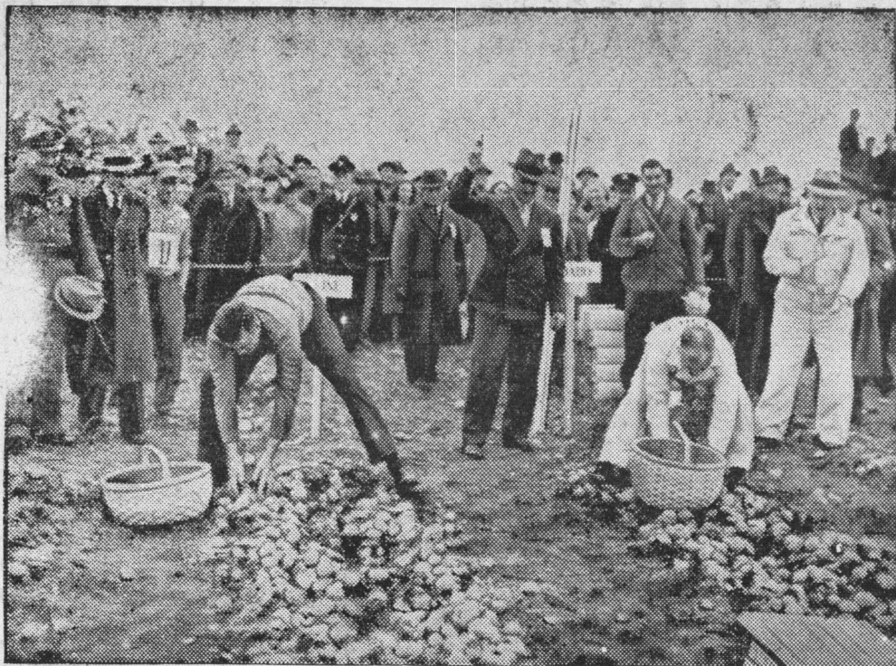
Dwaj amerykańscy gubernatorzy urządzili wesoły wyścig zbierania ziemniaków. Zwycięzca pokonał swego kolegę różnicą 2 kg.

Zrealizowanie tego postulatów widzimy przede wszystkim w poszerzeniu ram postępowania układowego przewidzianego w rozdziale VII rozporządzenia z dnia 24 X 1934 r. o konwersji i uporządkowaniu długów rolniczych (Dz. U. R.P. nr 94 poz. 841). Postępowanie to przewiduje pewne możliwości zmniejszenia globalnej sumy długów, ciążyących na gospodarstwach większych (grupa B i C). Ponieważ zadłużenie gospodarstw ma charakter powszechny, dotyczy gospodarstw wszystkich kategorii wielkości, przeto, zdaniem naszym, nieodzownym jest włączenie najliczniejszej grupy gospodarstw, tj. gospodarstw włościańskich t. zw. grupy A w ramy postępowania układowego. Skoro art. 60 cytowanego wyżej rozporządzenia, przewiduje, że „posiadacze gospodarstw wiejskich, którzy korzystali z ulg przewidzianych w rozdziałach poprzedzających, bądź z ulg tych nie skorzystali z uwagi na stopień zadłużenia lub z powodu innych okoliczności, a którzy zaprzestali płacenia swoich zobowiązań prywatno-prawnych lub publiczno-prawnych, mogą być poddani postępowaniu układowemu”, to nie widzimy powodów, dla których właśnie gospodarstwa najmniejsze, których