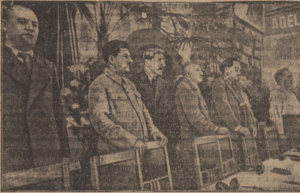
W Moskwie obradowali ostatnio przywódcy światowej rewolucji, członkowie Kominternu ze Stalinem na czele (drugi od lewej).