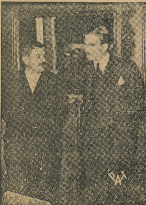
W drodze do Genewy angielski minister spraw zagranicznych Eden zatrzymał się w Paryżu i odbył naradę z premierem Lavallem. Na zdjęciu premier Laval w rozmowie z min. Edenem.