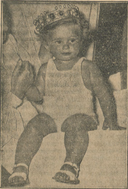
Czy ten rozkoszny bobas, ogłoszony najładniejszym dzieckiem na wystawie światowej w Brukseli, nie jest przemity?