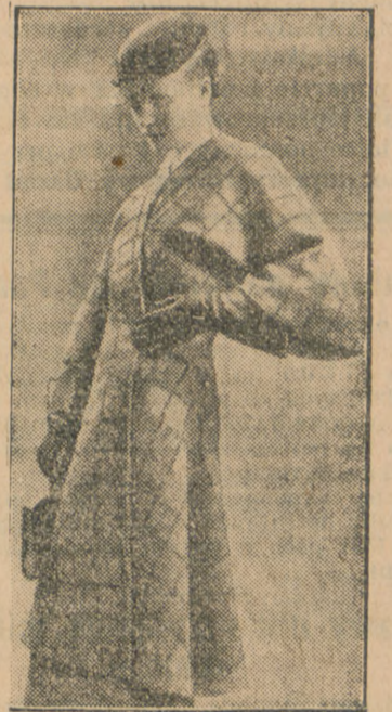
Gustowny komplet jesienny.