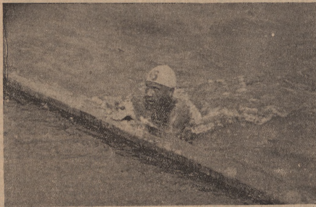
Zdobywca pucharu „Dnia Pomorskiego”, młody zawodnik „Fala” z WKS. Grudziądz w chwili dobijania do mety.

W dalszym ciągu wymienić tu musimy Zarząd Dróg Wodnych w Toruniu, który przychodząc nam z pomocą, nie tylko wypożyczył motorówkę „Nur”, lecz postarał się także o zapewnienie zawodnikom wolnej trasy na Wiśle. Podkreślić również pragniemy sprawne