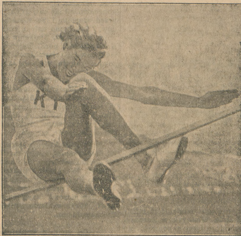
W pogoni za rekordami w sporcie kobiety nie ustępują w niczem mężczyznom.