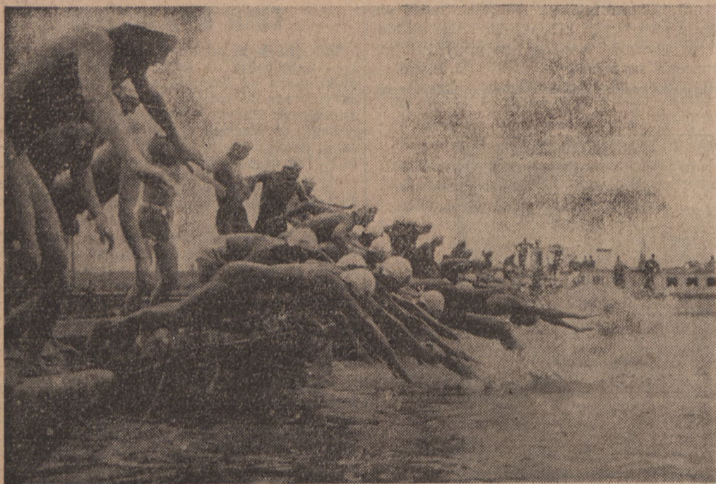
Start zawodników z pomostu powyżej starego mostu kolejowego.