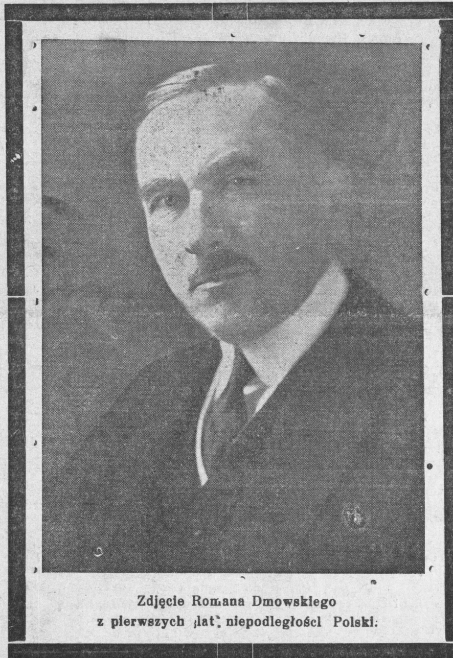
Zdjęcie Romana Dmowskiego z pierwszych lat niepodległości Polski.

Przy swym wielkim horyzoncie wiedzy, fenomenalnym darze przewidywania, który jest tak nieodzowną cechą prawdziwego polityka, przy ogromnych zasługach budowania od czasu mroków niewoli do dnia dzisiejszego systemu polityki naprawdę polskiej, polityki narodowej, której dziś muszą holdować Jego najzaciejsi przeciwnicy, był najznakomitszy polski mąż stanu człowiekiem nad wyraz skromnym. Wszak ostatnią wolą Dmowskiego było, by pogrzeb Jego był jak najskromniejszy, bez przemówień nad trumną.