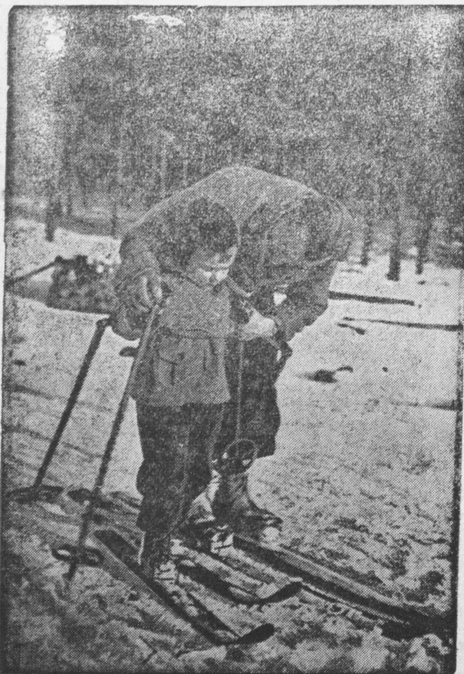
Pierwsze kroki na nartach.