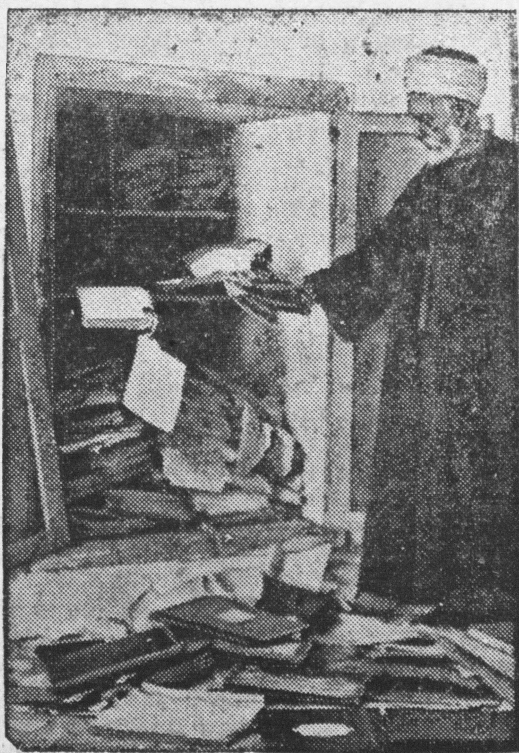
Podziwiał u wielkiego muftiego w Jerozolimie. Mieszkanie znajduje się w obrębie obszaru meczetu zabronionego dla cywilów.

Warszawa. W Raciborzu na Śląsku Opolskim tajna policja polityczna skonfiskowała cały nakład śpiewnika polskiego, wydanego dla uczczenia 50-lecia polskiego towarzystwa górniczego.