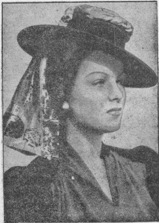
Moda wróciła do łask kapelusze hiszpańskie.

W lecie, zwłaszcza w dni upalne, bardzo ważnym składnikiem w odżywianiu dzieci są napoje. Istnieje wiele przesądów, dotyczących picia wody. Rodzice często wzbraniają dzieciom picia wody nawet wówczas, gdy są wypoczęte i niezgrzane. Tymczasem woda jest dla ich organizmu niezbędną. Oczywiście woda winna być zdrowa (źródłana lub z wodociągów), w niepewnych wypadkach dajemy wodę przegotowaną i wystudzoną.