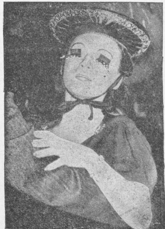
Krzyk mody ekscentrycznych Amerykanek: zapalki przyklepione do rzęs.

obmyć owoc przed jego spożyciem, gdyż kurz, resztki truć, pochodzących z tępienia owadów itp. pozostają na powierzchni owocu i przy spożyciu dostają się do organizmu człowieka i żołądek cierpi. Niektórzy nie znoszą wiśni, które powodują kurcze żołądkowe. Również mleko powoduje choroby żołądka i kiszek. Należy je oczywiście podczas lata pić tylko przegotowane. Przeciw niedomaganiom żołądkowym używa się starych wypróbowanych środków domowych, jak herbatę rumiankową i mletową. Jeżeli jednak bóle nie ustają, należy zasięgnąć rady lekarza, bo zachodzi obawa poważnego zachorzenia.