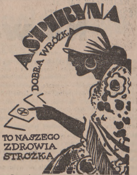
Do nabycia we wszystkich aptekach.

Stowarzyszenia katolickie, służące celom religijnym i wyznaniowym już istniejące będą mogły skorzystać z tego rozporządzenia, o ile w ciągu 6 miesięcy od dnia wejścia w życie rozporządzenia, biskup diecezjalny zawiadomi władze wojewódzkie o udzieleniu przez siebie zgody na dalsze istnienie tego stowarzyszenia.