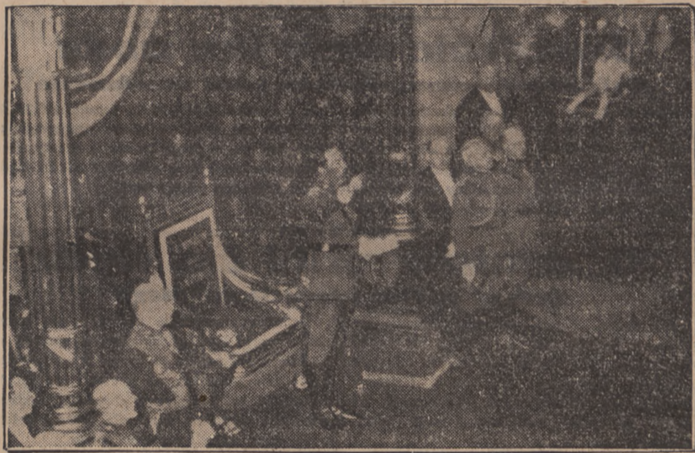
Młody król Belgów składa przysięgę na konstytucję