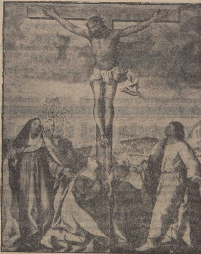
Dzielo nieznanego mistrza z pierwszej połowy XVII. wieku