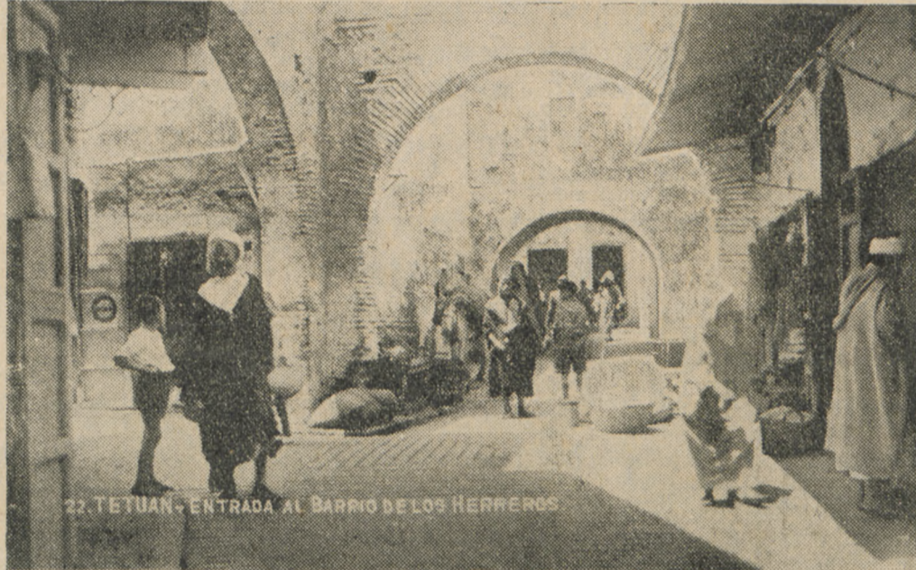
Ulica w Tetuanie.

domach, pensjonatach i hotelach. Leitmotywem ogłoszeń, wywieszonych na narożnikach, bramach i słupach, drukowanych w gazetach, są dwa wyrazy: „à vendre“. A więc można dziś za „psie pieniądze“ wynająć i wykupić wszystkie nieruchomości, ale niema na nich amatorów; nie opłacają się. Przerzedziły się szeregi milionerów amerykańskich, an-