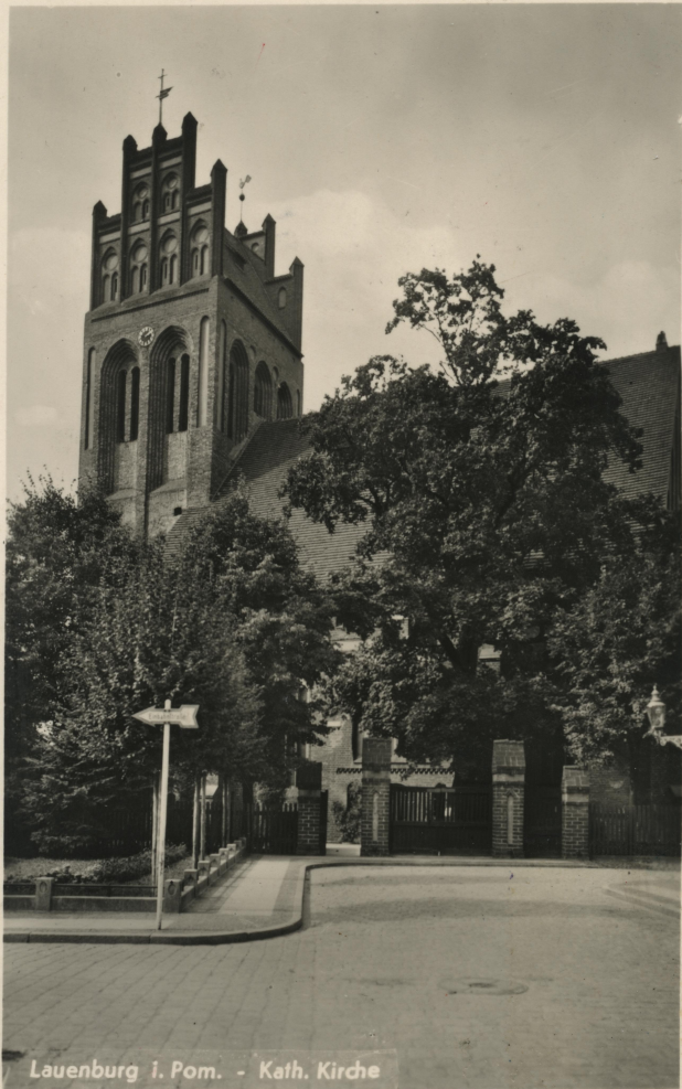
Lauenburg i. Pom. - Kath. Kirche